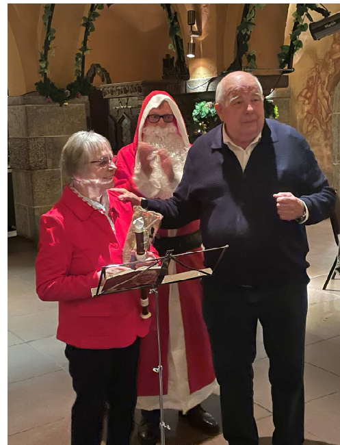
Gemeinsames Essen im Ratskeller