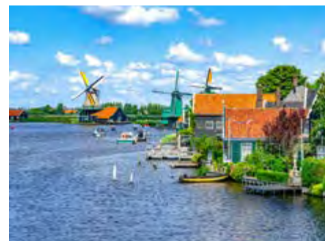
Sommer in Holland