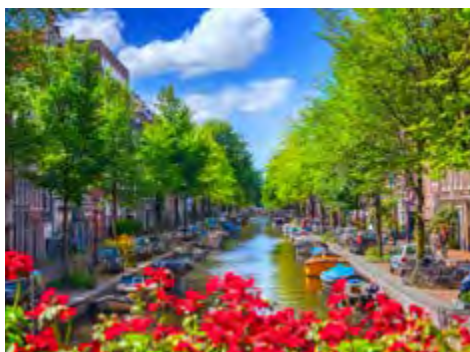
Amsterdamer Gracht ©adisa - stock.adobe.com, GLOBALIS