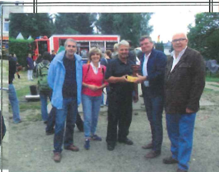
Danke an die FFW-Rahlstedt