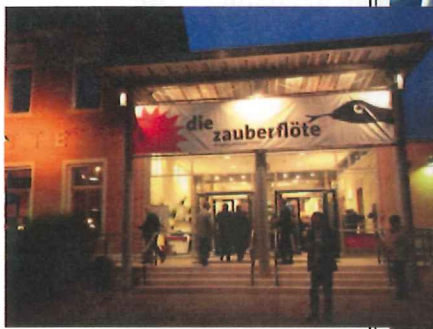
Dresdner Staatsoperette „Die Zauberflöte“