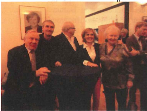
Siegesfeier im Landesverband