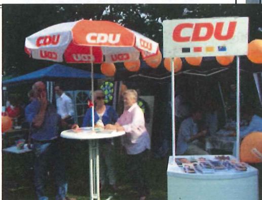
07.09.13 – Nachbarschaftsfest Hohenhorst – Rahlstedt und Jenfeld