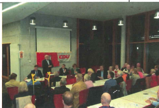
17.10.13 – Ortsversamm- lung und Ortsmitglie- dersamm- lung