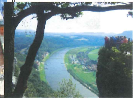
Sächsische Schweiz, hier die Bastei