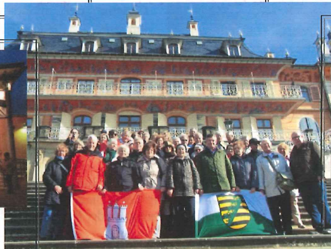
03.10.13 Dresden-Fahrt – hier vor dem Schloss