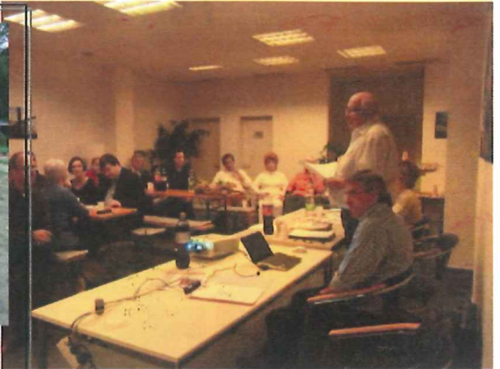
23.09.13 - Ortsvorstandssitzung