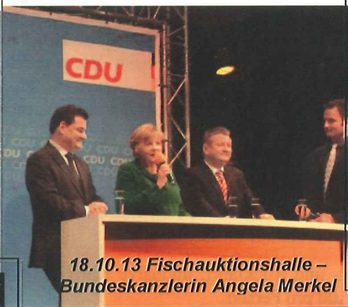
18.10.13 Fischauktionshalle – Bundeskanzlerin Angela Merkel